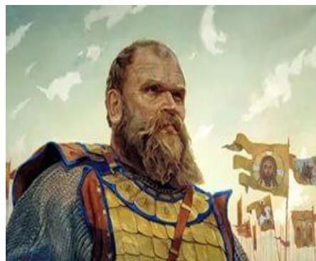
Д. И. Донской

Куликовская битва 1380 г. – важнейшее событие в истории средневековой Руси, во многом определившее дальнейшую судьбу Российского государства. Битва на Куликовом поле послужила началом освобождения Северо-Восточной Руси от ига Золотой Орды и навсегда вошла в историю России. Победа на Куликовом поле ассоциируется, прежде всего, с именем князя Дмитрия Донского, который предстает перед нами в образе защитника Руси и великого полководца. Страшные бедствия принесло татаро-монгольское иго на русскую землю.