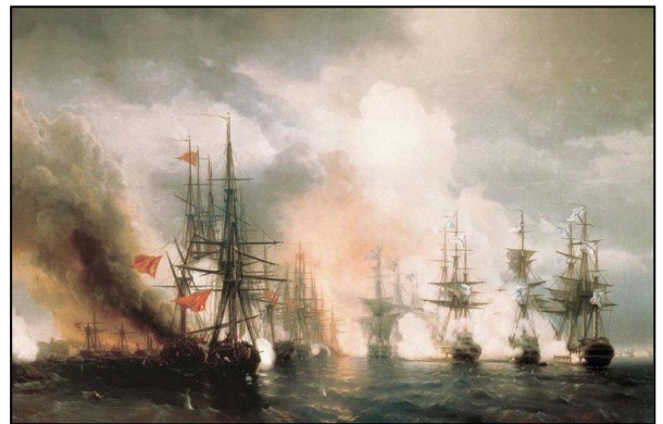
Картина И.К. Айвазовского "Синопский бой" (1853) написана со слов участников сражения

В Синопском бою наглядно проявилась эффективность передовой системы обучения и воспитания воинов-черноморцев. Высокое боевое мастерство, показанное моряками, было достигнуто упорной учебной, тренировками, походами, овладением всеми тонкостями морского дела.