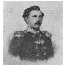
П. С. Нахимов

Морское сражение при Синопе произошло в самом начале Крымской войны. Начавшись в октябре 1853 г. между Россией и Турцией, она вскоре переросла в вооруженное столкновение России с сильной коалицией Турции, Англии, Франции и Сардинии. Это было последнее крупное сражение парусных кораблей и первое, в котором использовались бомбические орудия (т. е. стрелявшие разрывными снарядами).