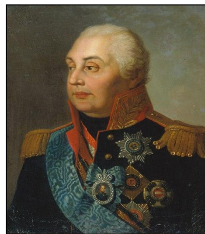
М. В. Кутузов

На перекличке к началу сражения французская армия насчитывала 135 тыс. человек «готовых к бою», при 587 орудиях. Русские войска — 125-130 тыс. человек, при 640 орудиях. Наполеон, оценив обстановку, решил нанести удар по левому флангу боевого построения русских войск, чтобы прижать их войска к Москва-реке и уничтожить.